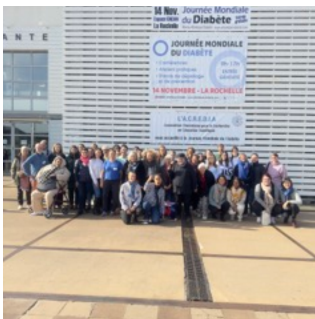
JMD 2024 - Bénévoles et patient

Organisée par l'ACREDIA (Association Charentaise de Recherche en Education Diabétique)